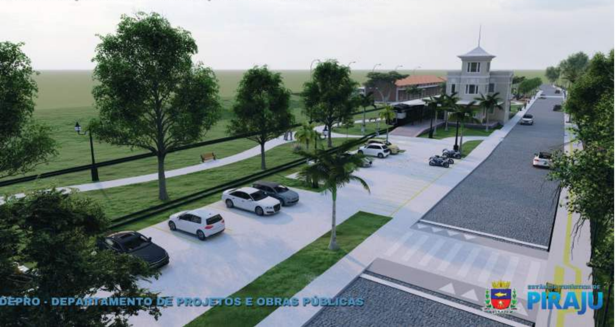
REVITALIZAÇÃO DA ANTIGA ESTAÇÃO FERROVIÁRIA DE PIRAJU

A revitalização da Estação Fepasa integra o planejamento do município para ampliar o potencial turístico de Piraju, aliando preservação histórica, uso cultural e desenvolvimento urbano.