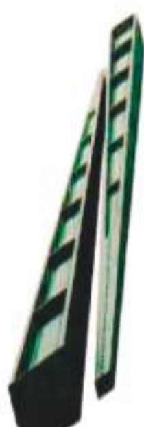
POSTES DT 90 A 300K

POSTE PADRÃO COM CAIXA (MONTADO), INSTALAÇÕES INDUSTRIAIS, MANUTENÇÃO DE ALTA TENSÃO, CABINES DE ALTA TENSÃO PARA-RAIOS, REDES DE CABO MULTIPLEX TRANSFORMADORES, ILUMINAÇÃO E PROJETOS